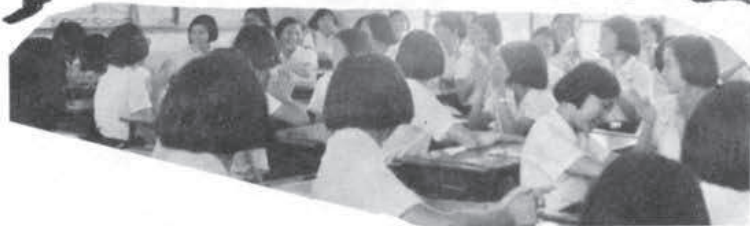
??? 事何生發! ? 噯