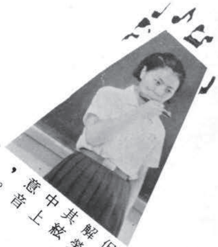
，意中其解但何 音上絃勞