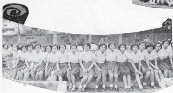
? 瘦最誰? 胖最誰! 看妳