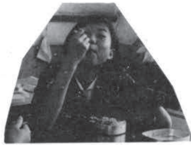
！啊小不倒福口！蔡小