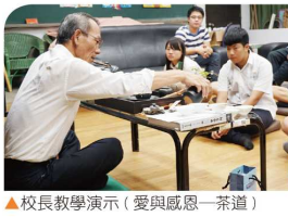
▲校長教學演示(愛與感恩—茶道)