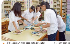
▲持續辦理閱讀教育—一年級圖書分類大賽