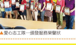
▲愛心志工隊—頒發服務榮譽狀