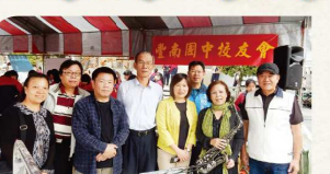
▲ 105.11.11 校慶義賣 - 薩克斯風吹奏