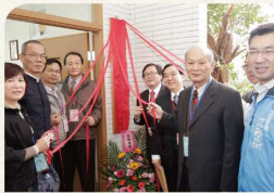
▲ 104.12.27 校友會會館揭牌啟用