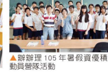
▲辦理 105 年暑假資優積木總動員營隊活動