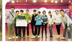
▲參加 105 年臺中市國民中學學生英語讀劇表演比賽榮獲佳作