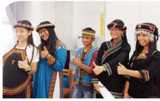
▲104 年全國語文競賽榮獲閩南語朗讀第五名、原住民族語朗讀第四名