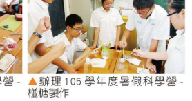
▲辦理 105 學年度暑假科學營-檯燈製作