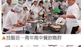
▲技藝班—青年高中餐飲職群