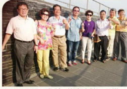
▲ 105.05.19 奇美、故宮南院一日遊