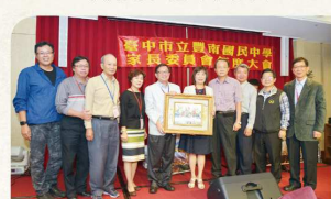
▲ 105.11.11 參加家長會授獎典禮