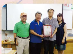
▲ 105.09.24 校友會沖咖啡技巧研習班