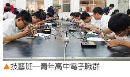
▲技藝班—青年高中電子職群