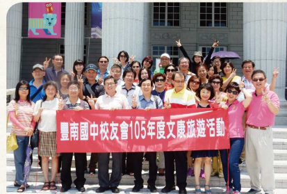
▲ 105.05.19 奇美、故宮南院一日遊