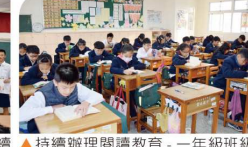
▲持續辦理閱讀教育—一年級班級書箱閱讀