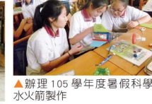
▲辦理 105 學年度暑假科學營-水火箭製作