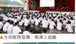
▲生命教育宣導—漸新人協會