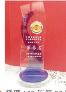
▲榮獲 105 年第 56 屆 中小學科學展覽會化學科國中組第三名