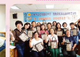
▲ 105.12.11 拼布初級班結業式