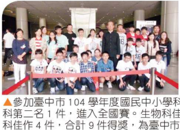
▲參加臺中市 104 學年度國民中小學科學展覽，榮獲數學科第一名 1 件，化學科第二名 1 件，進入全國賽。生物科佳作 1 件、生活與應用科學科 2 件、數學科佳作 4 件，合計 9 件得獎，為臺中市團體總積分第三名