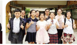
▲105 學年度語文競賽分區賽榮獲團體 C 區第二名