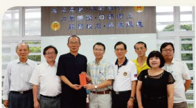
▲ 105.07.11 第6屆捐贈母校獎學金