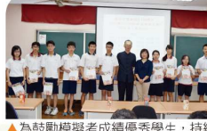
▲為鼓勵模範考成績優秀學生，持續辦理「與校長及家長會長有約」活動