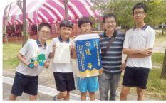
▲參加 105 年臺中市國小創意環保科學趣味競賽榮獲優等