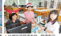
▲持續辦理閱讀教育—閱讀聖誕