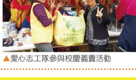
▲愛心志工隊參與校慶義賣活動