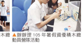
▲辦理 105 年暑假資優積木總動員營隊活動