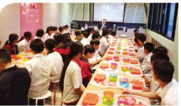
▲一年級社區職場參訪—賞家食品