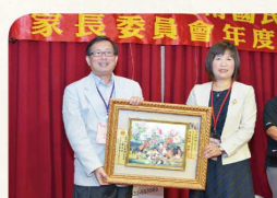
▲ 105.11.11 參加家長會授獎典禮