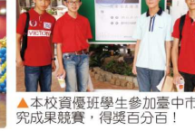
▲本校資優班學生參加臺中市 105 年度國教階段資賦優異學生獨立研究成果競賽，得獎百分百！榮獲優等一件、甲等二件