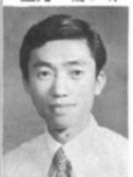
師導九三 生先 男勝魏