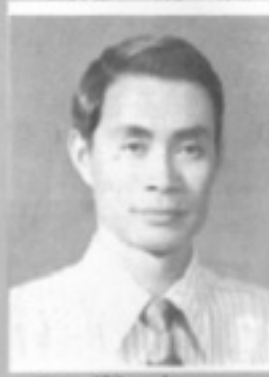
師導六一 生先 昌均丘