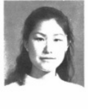
師導一 生先 珠敏井