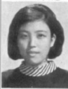
師導四二 生先 玲慧明