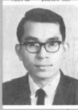
師導五一 生先 彥永魏