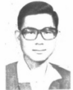
師導三二 生先 昌傳熊