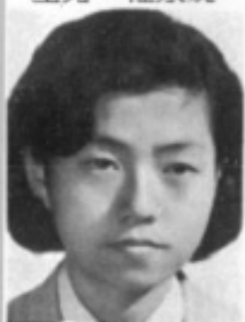
師導一 生先 瑰玫黃