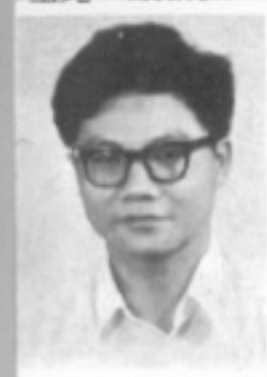
師導五一 生先 超士張