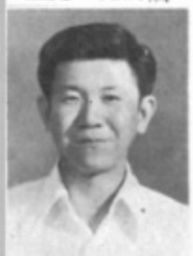
師導六三 生先 村漢謝