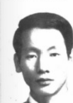
長 組 育 訓 生先 義里丁