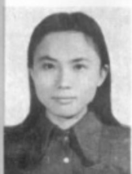
師導四三 生先 枝玉張