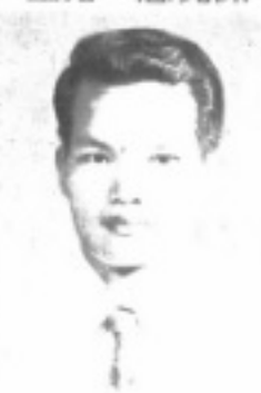
師 導 十 三 長 團 軍 童 生先 加信鄭