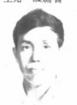
長 組 理 管 生先 峰明劉