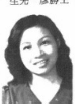
長 組 納 出 生先 如蕙賴