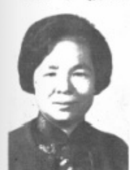
師導一 生先 貞桂桑