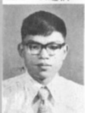
師導八三 生先 權永魏