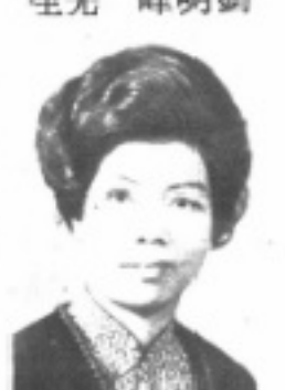
長 組 書 文 生先 華佩吳