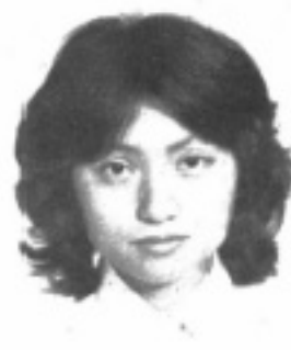
師導六二 生先 貞美宋