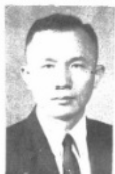
長 組 冊 註 生先 慧晃陳