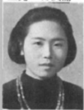
師導三二 生先 濛美宋