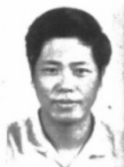
任主 務 教 生先 珍掌王