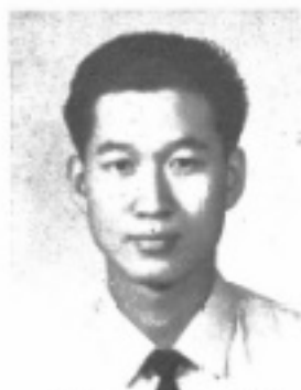
師導七二 生先 宇文黃