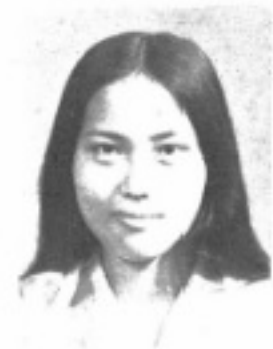
師導一 生先 蘇化鄧