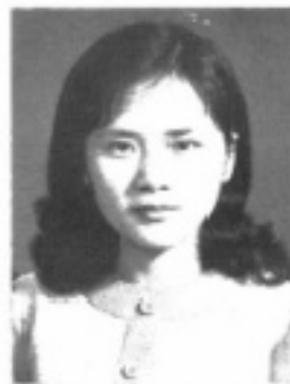
師導六二 生先 雪映蒲