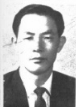
任主任事 生先 心德鄧