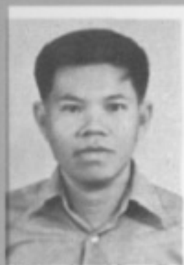
師導九一 生先 康裕福