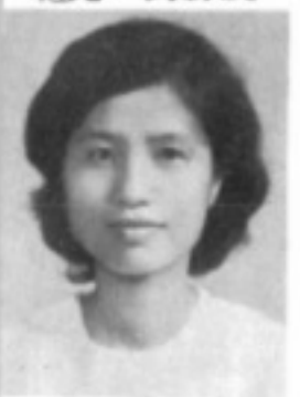
師導六二 生先 霞翠吳