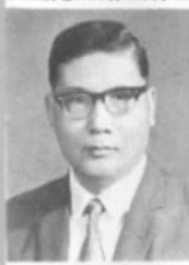
師導七一 生先 循莊