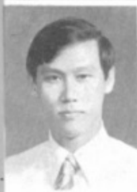
師導二一 生先 仁廣程