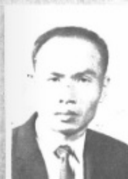
長 組 務 庶 生先 祥金柯