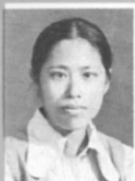
師導六三 生先 珍蓓鄭