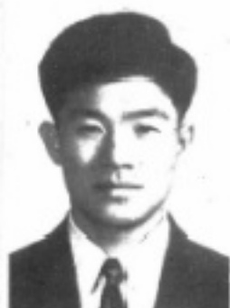
任主 導 訓 生先 芳生林