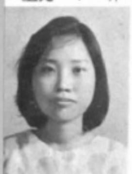
師導五三 生先 鸞彩郭