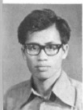
師導六三 生先 充計詹