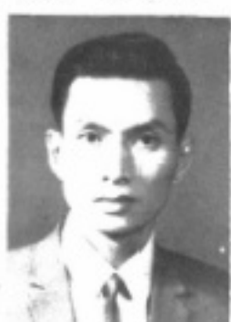
長 組 學 教 生先 正暉張