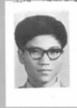
師導五一 生先 欽胡黃