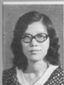
師導三三 生先 珠玉饒