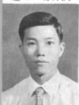
師導三三 生先 男昭廖