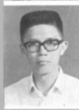
師導六一 生先 樹國張