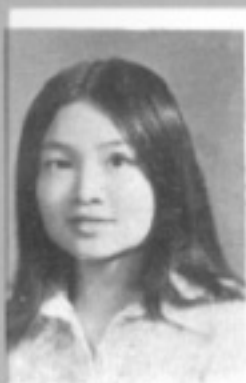
師導八一 生先 惠碧李