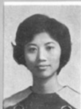
師導一三 生先 華林