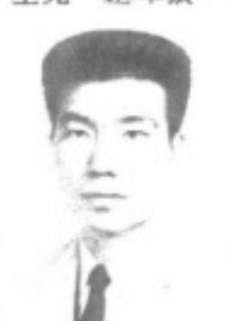
長 組 衛 體 生先 彥勝王