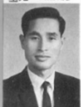
師導七三 生先 聰啓張