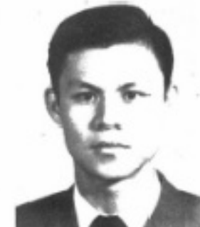
師導九二 生先 養廷紀