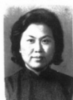
書 秘 防 保 生先 霞劍曹