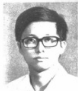
師導六二 生先 呈錦林