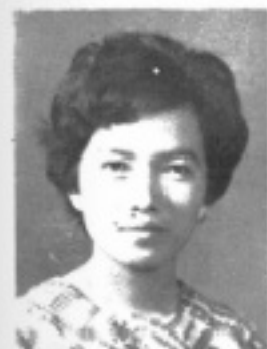
師導五 生先 玉艷張