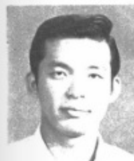
師導三二 生先 年強趙