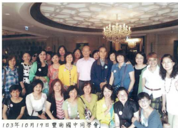
103年10月19日豐南國中同學會