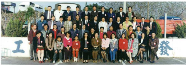
豐南國中第一屆畢業生同學會留念 85年2月4日