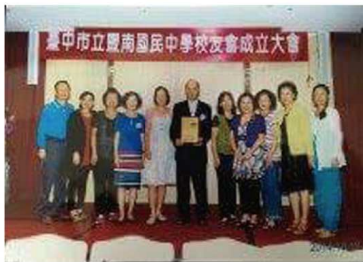
第三屆同學於校友會成立大會時合影