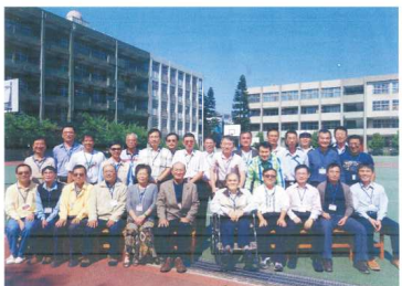
第五屆3年11班於102年5月11日在母校舉辦同學會合影