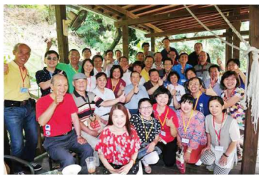
第六屆同學於104年9月26日在情人谷同學會大合照