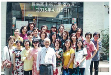
第五屆3年5班於104年4月18日同學會合影