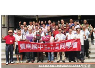
第七屆3年18班同學於104年9月13日在五都飯店舉辦第一次同學會