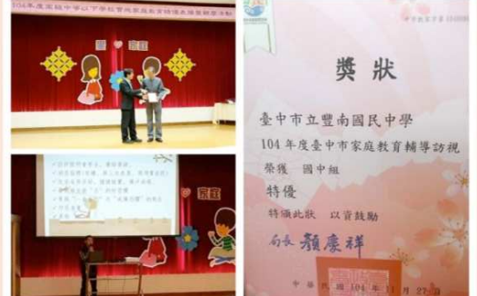
校內師生共同努力，推行校內家庭教育，榮獲家庭教育輔導訪視國中組特優，校長代表受獎，主任分享經驗與心得。