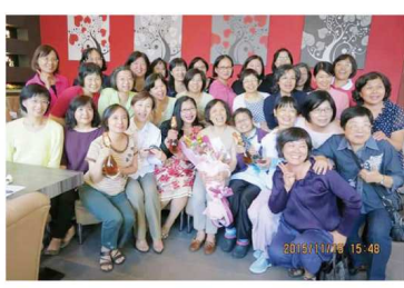
第六屆三年六班在宛宛老師的真心呼喚下齊聚一堂