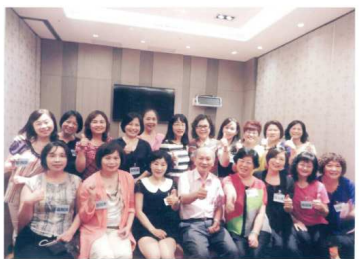
第五屆3年6班於103年8月2日同學會合影