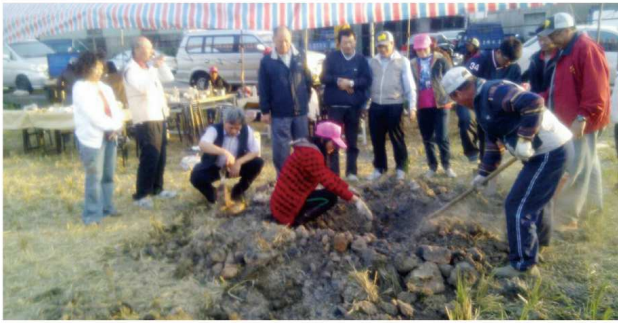
第一屆同學於民國103年在社皮三山國王廟舉辦燻蜂活動