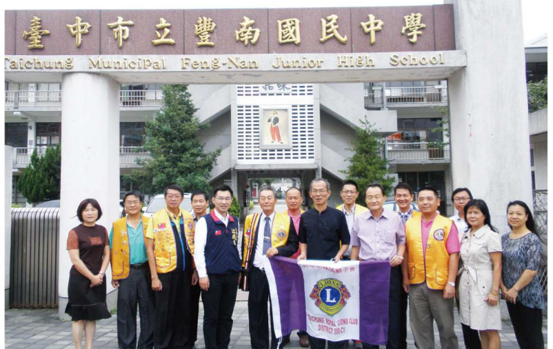
台中市精誠獅子會來校捐贈基金