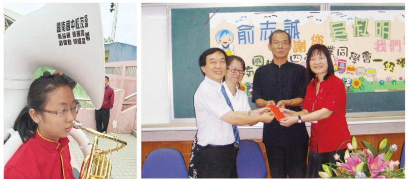
校友會捐贈蘇沙號